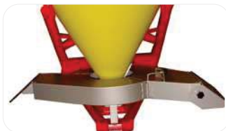
Distribuidor bilateral puntual opcional Distribuidor bilateral puntual opcional