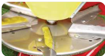
Disco inox con 6 paletas Disco inox con 6 palhetas